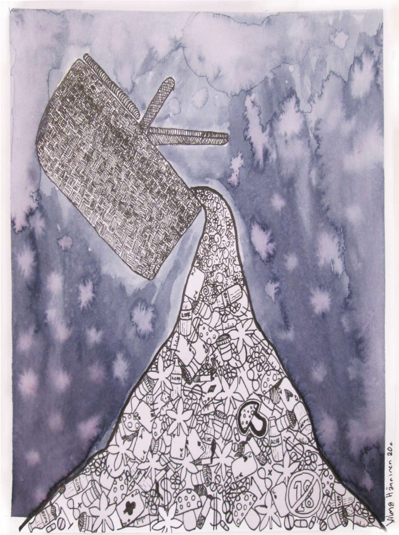
Vilma Hänninen 20e