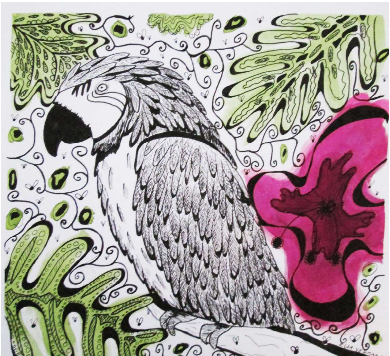
Elsa Vehmaa 20 a